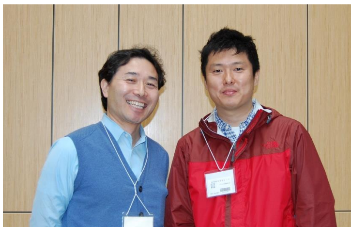
福島 PTA 会長